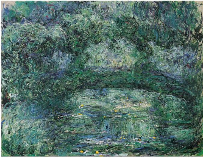
Claude Monet, El puente Japonés

Las pinceladas pictóricas son quizás el rasgo más reconocible del impresionismo. A diferencia de las pinceladas cuidadosamente homogeneizadas de los movimientos anteriores, los artistas impresionistas emplearon pinceladas gruesas, como si se tratara de un boceto. Estas marcas rápidas capturan la naturaleza efímera y fugaz de los momentos en el tiempo y permitieron a los artistas experimentar con el color y las formas en que los diferentes tonos interactúan sobre el lienzo.