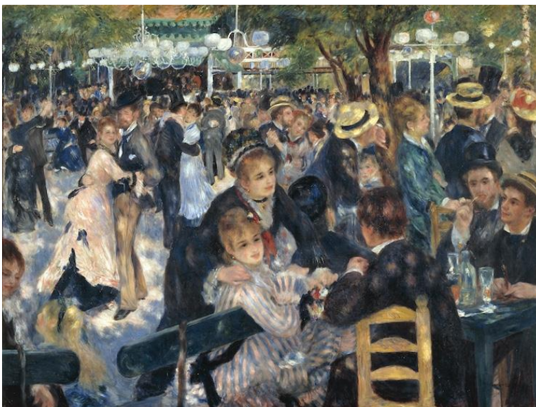
Pierre-Auguste Renoir, Baile en el Moulin de Gaete.