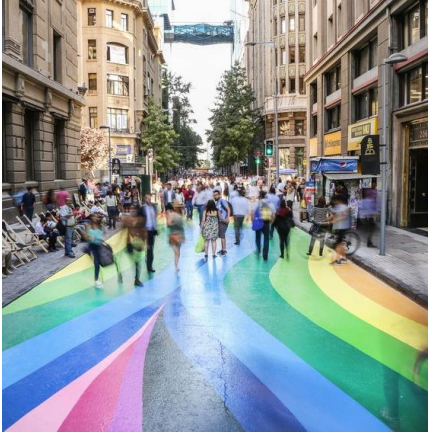
Artista: Dasic Fernández Paseo Bandera. Santiago.