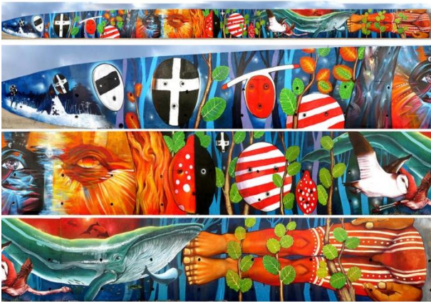
Artista: ALAPINTA Selknam. Tierra del Fuego, Chile.