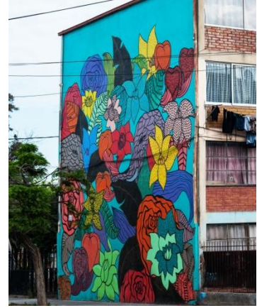
Artista: Estanpintando Las Flores. Museo a Cielo Abierto. San Miguel, Santiago.