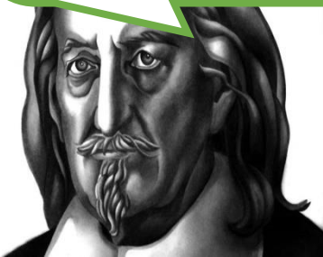
Thomas Hobbes (1588-1679) Filósofo inglés

El pueblo necesita una fuerza que les inspire temor reverencial, o de lo contrario pasarían en guerra. Necesitamos un gobierno con leyes que nos mantenga unidos, coartar la libertad para mantener la paz.