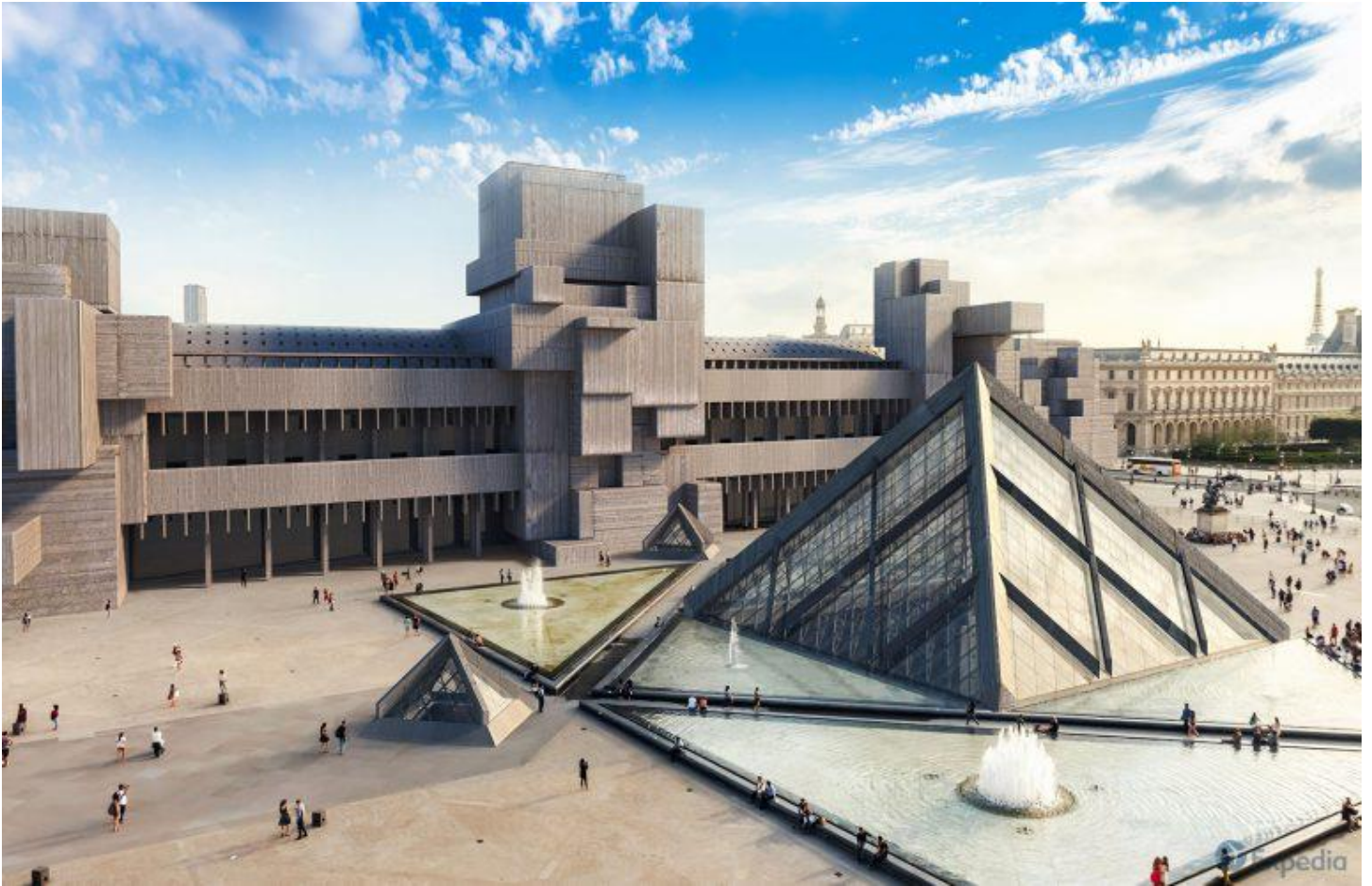
Museo de Louvre, París, Francia.