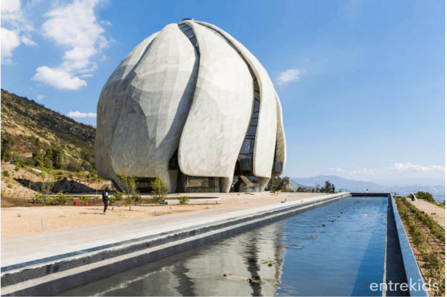
Templo Bahai, Chile, Santiago.