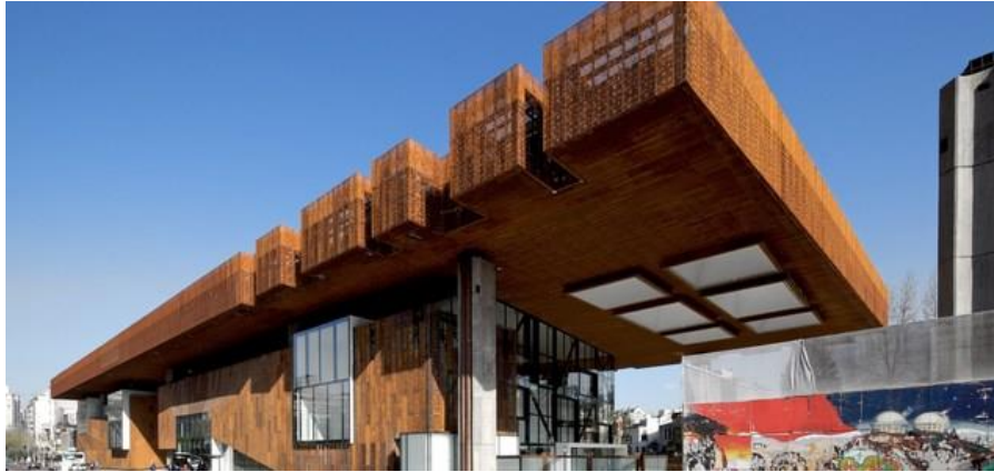
Centro Cultural Gabriela Mistral, Santiago de Chile.