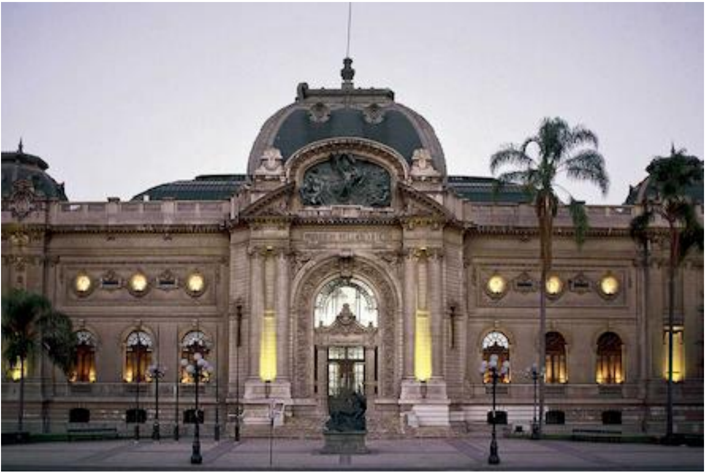
Museo Nacional de Bellas Artes, Chile, Santiago.