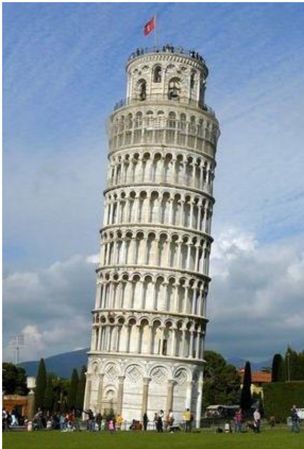
Torre de Pisa, Italia.