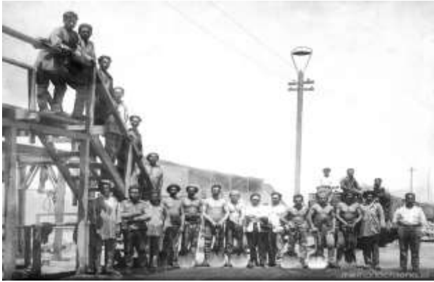
Trabajadores del salitre, oficina Mapocho, Chile, 1900.

La creciente demanda de salitre y la anexión por parte de Chile de los territorios ricos en este mineral, permitió al Estado experimentar un gran crecimiento económico durante las últimas décadas del siglo XIX e inicios del siglo XX, siendo un factor fundamental en las transformaciones políticas y sociales del período.